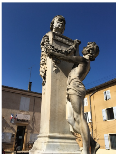
Aspect actuel de la statue de St Julien

Une description pittoresque de la tête du savant se trouve dans la Revue du mois : « La tête se penche en avant dans l'attitude habituelle que reproduiront tous les portraits. Les joues, un peu tombantes et les