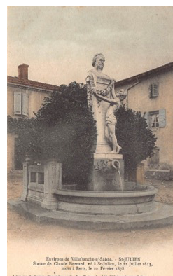
Carte postale datée de 1913