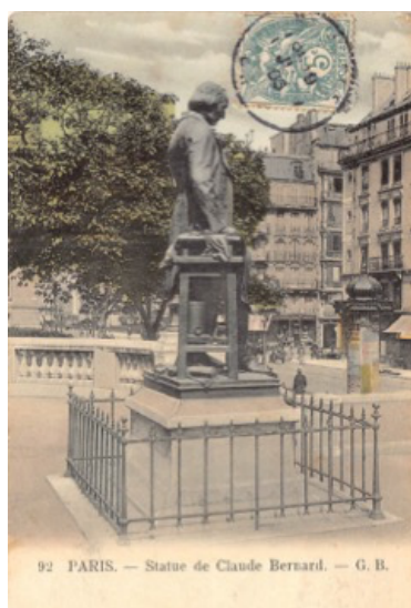
92 PARIS. — Statue de Claude Bernard.

À l'initiative de Paul Bert, une souscription est ouverte en 1878 par la Société de Biologie. Le Conseil municipal de Paris accorde une subvention de 1000 francs et la ville autorise l'érection de la statue devant le Collège de France, rue des Écoles. Œuvre du sculpteur Jean-Baptiste Eugène Guillaume (1822-1905) 4 et des fondeurs Thiébaud Frères, cette statue en bronze de près de trois mètres de haut est inaugurée le 7 février 1886, à dix heures, « sous la présidence d'honneur de M. le Ministre de l'Instruction publique et des Beaux-Arts », en présence de Paul Bert, Louis Pasteur, Ernest Renan, Marcelin Berthelot. 5 Sur le chevalet, la statue comporte le corps d'un chien disséqué et l'inauguration est perturbée par des membres de la Ligue anti-vivisection. 6