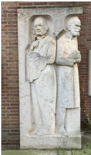
La statue de Leiden Claude Bernard et Yvan Pavlov