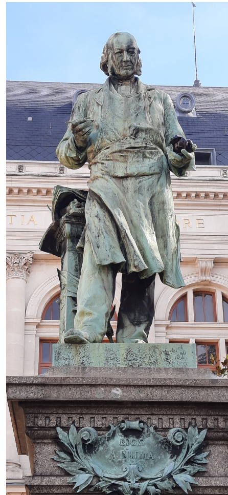
La statue lyonnaise aujourd'hui

La garde du monument en revient à l'Université de Lyon. Pendant la Seconde Guerre mondiale, un subterfuge permit de conserver cette magnifique statue. L'Académie de Lyon prétextait un moulage préalable de la statue, entoura le monument d'une palissade de planches et fit disparaître la statue « sous la barbe de l'occupant » pour la cacher dans un sous-sol de la Faculté ! Elle sera réinstallée sur son piédestal après la Libération.