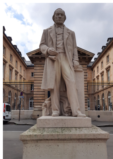
Statue parisienne (2 ème version en pierre) Statue actuelle

Ce monument est différent : Cl. Bernard a le bras droit replié et le pauvre chien a disparu. La petite grille qui protégeait la statue en bronze a été enlevée plus tard. C'est l'unique statue qui accueille le visiteur à l'entrée du prestigieux Collège de France.