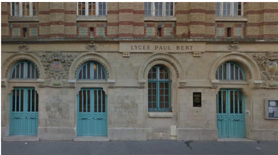
Un des nombreux lycées Paul Bert en France, celui de Paris (14 ème )

Après la députation, sa nomination en tant que Ministre de l'Instruction Publique et des Cultes sous le gouvernement de Gambetta (qui ne dura que neuf semaines, de novembre 1881 à Janvier 1882) va lui permettre de défendre avec fougue et de faire voter les lois qui sont à la base de notre système éducatif actuel. En effet, plus encore que Jules Ferry, à qui on en attribue le mérite, Paul Bert est le véritable artisan de l'école laïque, gratuite et obligatoire . On lui doit aussi l'introduction de l'enseignement des sciences en primaire (les premiers livres scolaires de sciences présentant, comme tous les manuels jusqu'à une période relativement récente, une classification des espèces et leurs différences), la création du certificat d'études pour que tous les élèves aient un même niveau d'éducation, et une véritable révolution, l'entrée des jeunes filles dans l'enseignement secondaire. L'éducation doit être une éducation identique et de haut niveau pour tous. « Une école de la République ! Une école où tous les enfants de France seraient accueillis sans distinction d'origine, recevraient le même enseignement, deviendraient des citoyens égaux en droits et en devoirs, élevés dans le culte de la Patrie. L'école c'est notre Eglise à nous ».