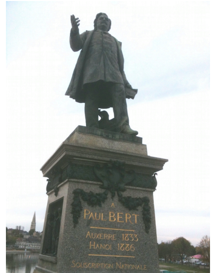
Statue de Paul Bert à Auxerre

Paul Bert savait qu'en allant en Indochine, il y avait des risques pour sa santé. Il n'eut pas le temps de faire aboutir comme il l'aurait souhaité toutes ces idées d'avant-garde. Malade six mois après son arrivée au Tonkin, il décède de la dysenterie à Hanoi le 11 novembre 1886. Ses funérailles nationales sont célébrées à Auxerre, sa ville natale, le 15 janvier 1887, et son ami, le célèbre sculpteur Bartholdi, dresse à sa mémoire un édifiant monument funéraire. Plus tard, une souscription nationale permettra d'ériger une statue en son honneur sur le pont qui traverse l'Yonne à Auxerre et qui porte son nom.